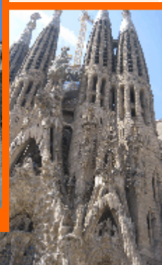
Собор «Саграда Фамилия»