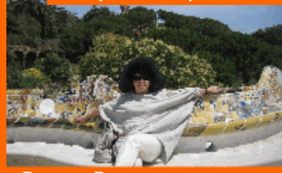
В парке Гуэля