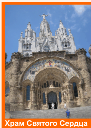
Храм Святого Сердца